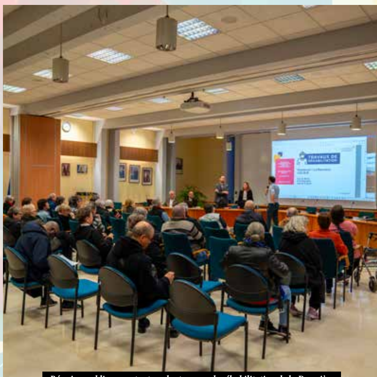
Réunion publique portant sur les travaux de réhabilitation de la Daunière

Un remerciement aux membres du Conseil citoyen qui suivent tous ses projets jusqu'à leurs réalisations.