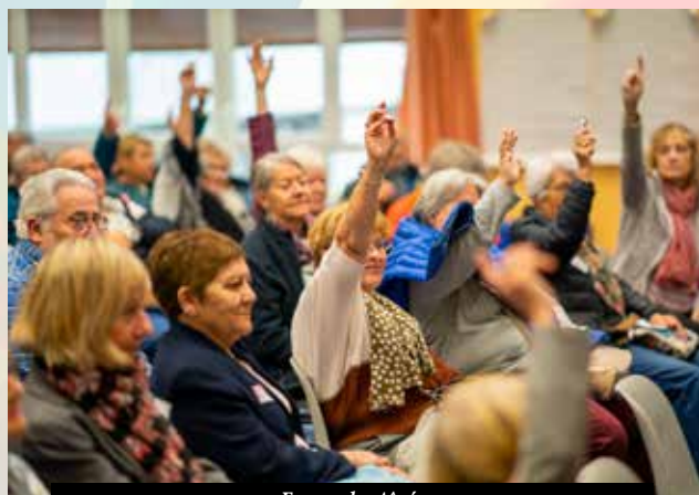
Forum des Aînés

Juste avant son renouvellement, le Conseil des Aînés participe à la préparation du grand événement du 8 octobre à l'Espace culturel Boris Vian, à savoir le Salon Bien Vieillir qui se penchera sur tous les aspects liés au vieillissement, préoccupation devenue majeure pour la municipalité des Ulis.