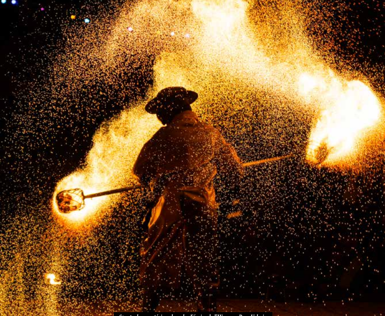
Spectacle en extérieur lors des Fêtes de l'Hiver au Parc Urbain

En témoigne le projet « Séjour citoyen » dont le lancement est prévu en novembre avec une considérable participation de la ville. Ce stage d'intégration citoyenne vise à accentuer le goût de la participation des jeunes aux activités associatives à travers des séances ludiques/formelles et des conférences.