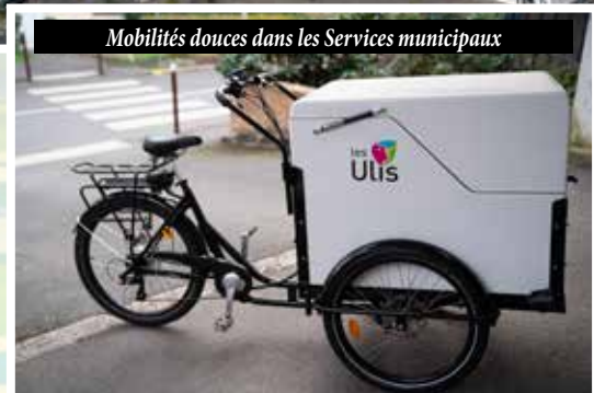
Mobilités douces dans les Services municipaux