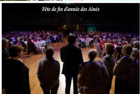
Fête de fin d'année des Aînés