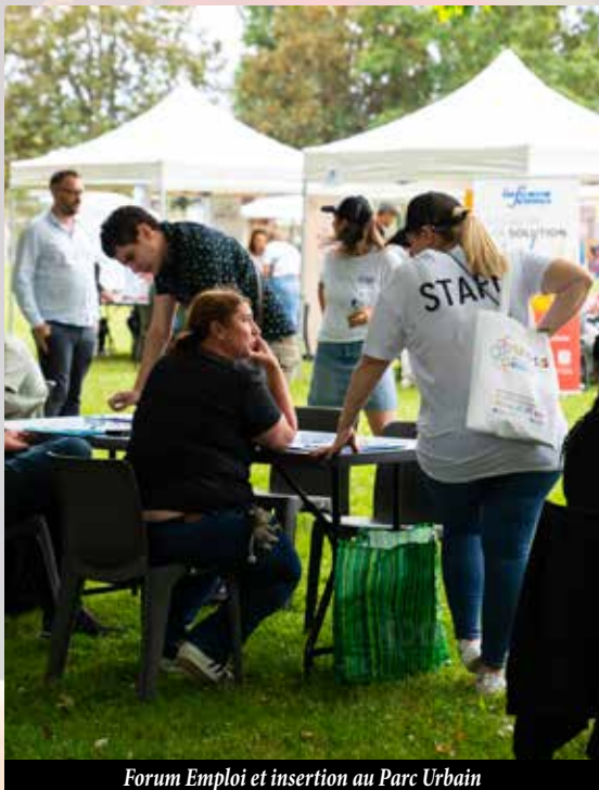
Forum Emploi et insertion au Parc Urbain

La municipalité des Ulis demeure résolument engagée à innover et à collaborer avec l'ensemble des acteurs. Renforcer la cohésion sociale et le dynamisme économique de notre ville est une réelle ambition.