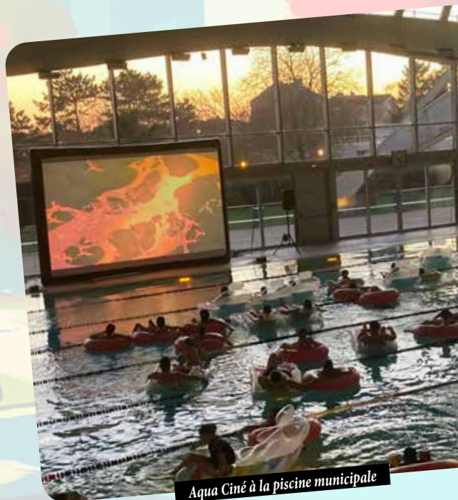
Aqua Ciné à la piscine municipale

Afin de donner une cohérence à l'ensemble des actions réalisées, un dispositif expérimental de Territoire d'Innovation Pédagogique (TIP) a été mis en place en partenariat avec l'Éducation nationale, qui a déjà donné lieu de nombreux projets de la maternelle au collège ( soirée des anciens élèves au collège Aimé Césaire , forum des métiers pour tous les élèves de 3 e , action annuelle de prévention aux deux roues pour tous les élèves de 5 e ... ). Ce dispositif est la prémisse de ce qui devrait prochainement aboutir à la création d'une « Cité éducative », un dispositif apportant des moyens considérables et pouvant permettre encore davantage de projets.