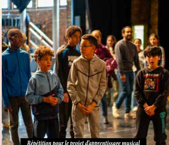
Répétition pour le projet d'apprentissage musical DEMOS à l'Espace culturel Boris Vian

Les premiers chantiers qui ont abouti sont l' extension de l'école des Avelines , l' extension de l'école de Courdimanche et l' extension de l'école du Parc qui sera prochainement livrée. En parallèle, un plan de végétalisation des grandes cours d'écoles a déjà débuté avec la végétalisation de la cour de Courdimanche , qui servira de base pour celle des Bergères ainsi que les autres groupes scolaires.