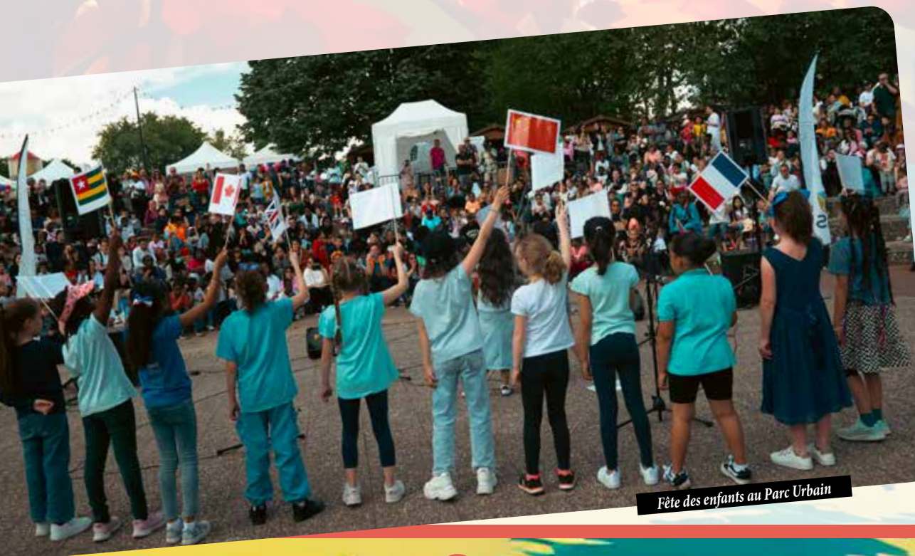
Fête des enfants au Parc Urbain

Dans les groupes scolaires et les accueils de loisirs, à l'intérieur desquels les enfants passent la majeure partie de leur temps, le bien-être passe par une prise de conscience que les locaux municipaux, après plus de quarante années d'existence, nécessitent une rénovation d'ampleur pour répondre aux rigueurs du climat, allant des grands froids aux fortes chaleurs. À cet effet, un plan pluriannuel d'investissement à hauteur de 6 millions d'euros par an a été adopté pour rénover massivement nos groupes scolaires.