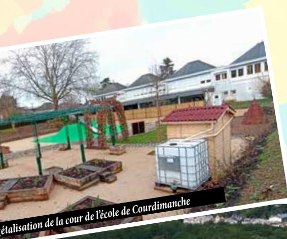
Étatisation de la cour de l'école de Courdimanche