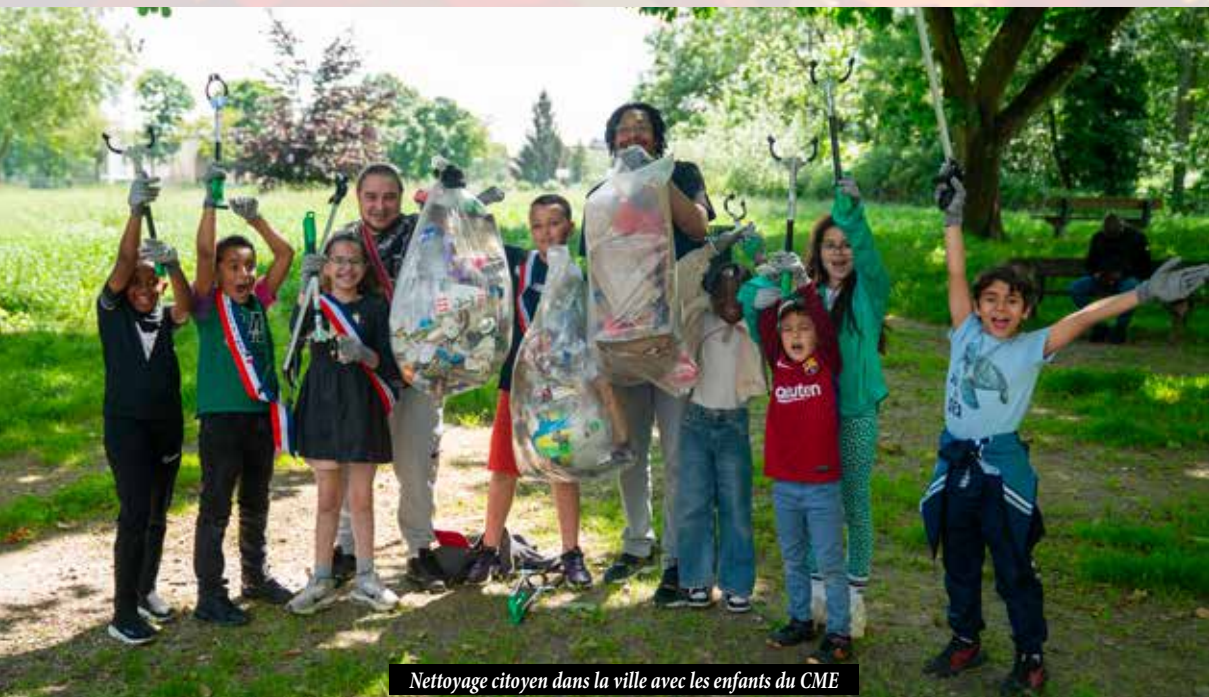
Nettoyage citoyen dans la ville avec les enfants du CME

Par ailleurs, nous sommes convaincus que l'engagement civique doit commencer tôt et est porteur d'un futur plus solidaire. Avec des instances telles que le Conseil Municipal des Enfants (CME) et le Conseil Municipal des Jeunes (CMJ), l'objectif est de raffermir le goût de la démocratie et de la participation à tous les niveaux.