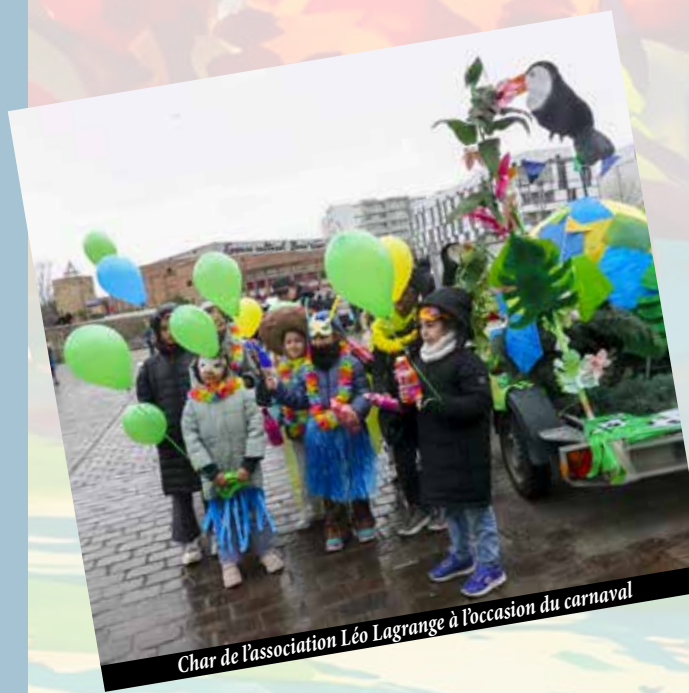
Char de l'association Léo Lagrange à l'occasion du carnaval