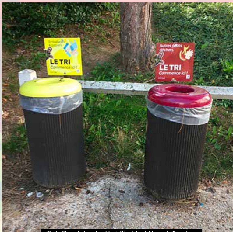
Corbeilles urbaines de tri installées à la résidence du Barceleau

Le contrat de ville constitue un autre levier d'action de la municipalité afin d'instaurer une dynamique nouvelle d'amélioration des conditions de vie de ses habitants. Notre opiniâtreté a ainsi permis une redéfinition de la géographie prioritaire avec l'arrivée du Quartier Est (Chataigneraie – Chanteraine – Barceleau) dans les zones d'intervention de la Politique de la ville. Cette nouvelle inclusion permet de mieux répondre