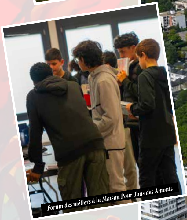
Forum des métiers à la Maison Pour Tous des Amonts