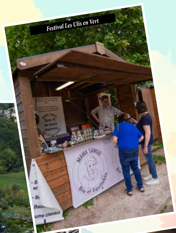
Festival Les Ulis en Vert