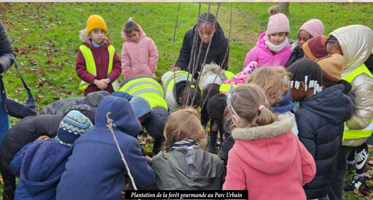
Plantation de la forêt gourmande au Parc Urbain

Nous n'avons actuellement pas un accès libre et équitable à une alimentation saine qui nous permet d'être et de rester en bonne santé. Nous souhaitons augmenter progressivement l'autonomie alimentaire mais également l'autonomie en connaissance : c'est pour ça que nous avons avancé vers une amélioration du cahier des charges de la restauration scolaire, mais aussi sur l'implantation de fruitiers à travers la ville et de