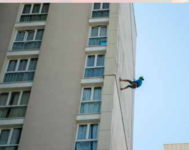
Première descente en rappel ouverte à tous sur une tour des Bergères

Aujourd'hui comme demain, cette dynamique positive est inscrite dans la durée. Nous nous engageons à poursuivre nos efforts pour développer constamment les infrastructures et enrichir l'offre d'activités sportives.