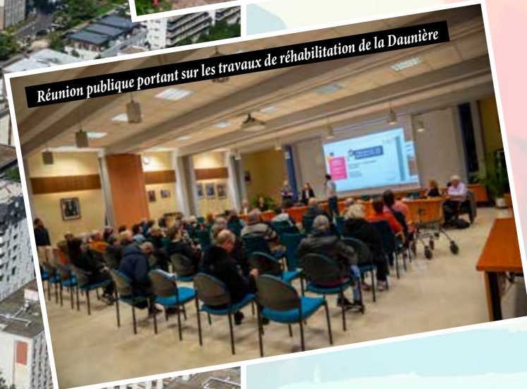
Réunion publique portant sur les travaux de réhabilitation de la Daunière