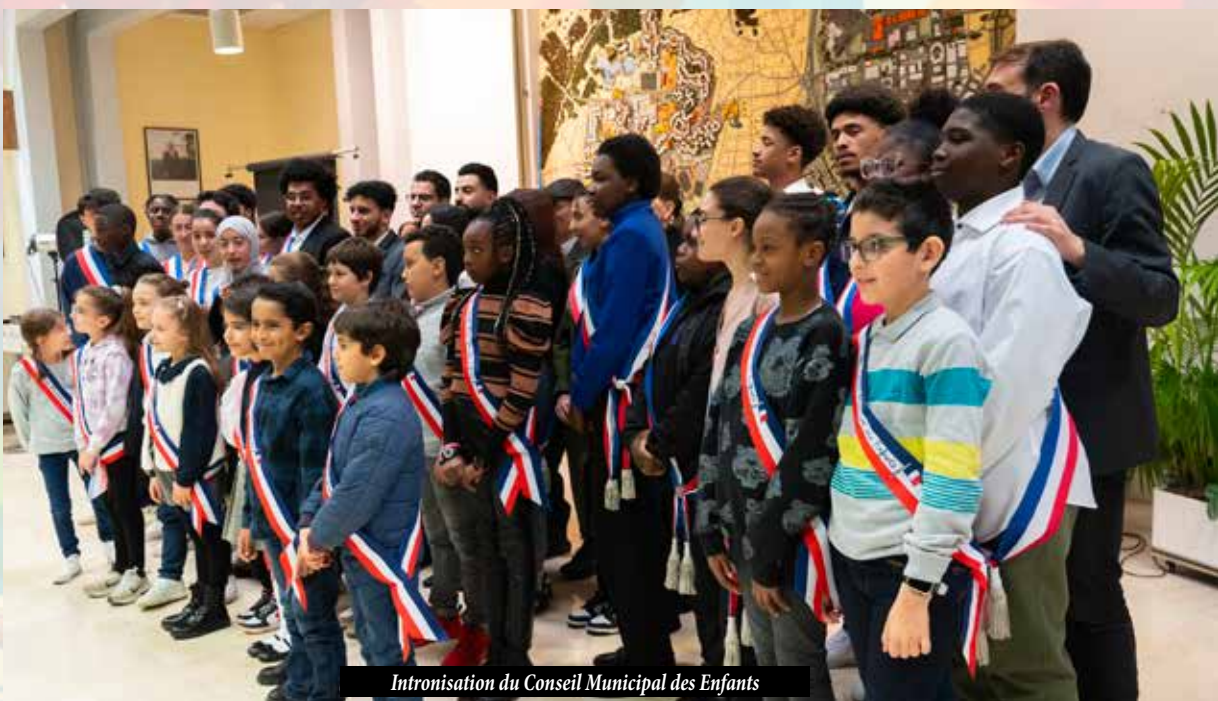
Intronisation du Conseil Municipal des Enfants