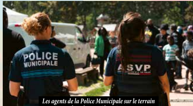
Les agents de la Police Municipale sur le terrain lors des manifestations

La tranquillité et la sérénité publiques resteront des priorités de notre agenda politique communal et afin de garantir la quiétude de chaque Ulissienne et Ulisien.