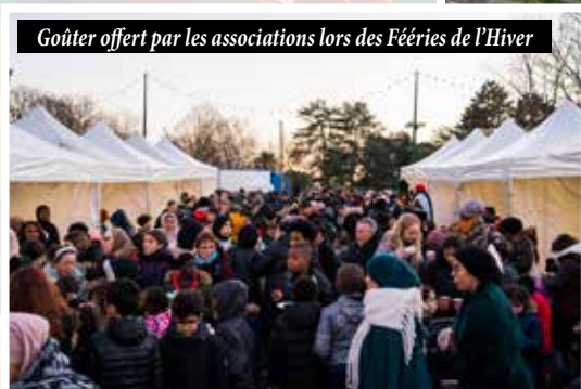
Goûter offert par les associations lors des Fées de l'Hiver