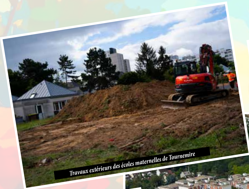
Travaux extérieurs des écoles maternelles de Tournemire